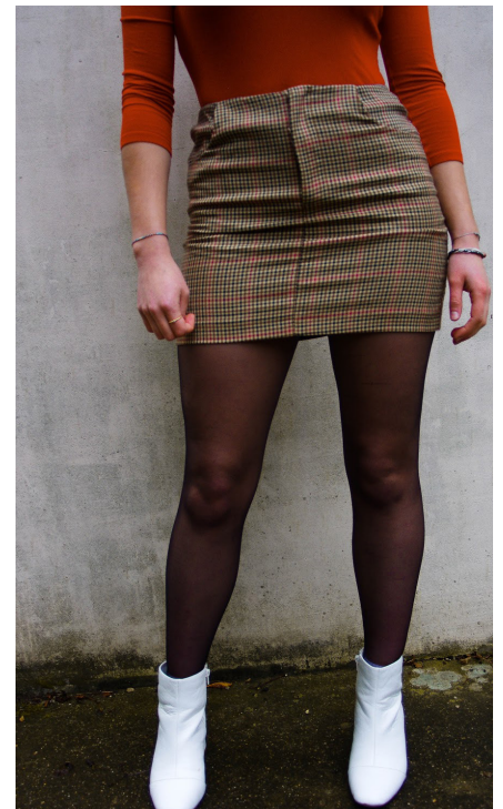
T-shirt rouge brique Bonobo, mini jupe à carreaux Pull&Bear, collants, bottines blanches Promod

Le velours côtelé, la laine et le traditionnel coton sont les matières à ne pas manquer cette saison.