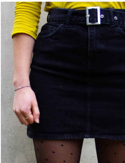
T-shirt jaune moutarde Mango, mini jupe noire à ceinture Primark, collants à pois Hema

Classique et chic : voilà les mots d'ordre pour cet automne 2019. Commençons par le bas : la jupe sera ta plus forte alliée durant cette saison, et tu as de la chance : il y en a pour tous les goûts ! On la choisira donc mini et taille haute, accompagnée d'une ceinture, de boutons ou d'une fermeture éclair sur toute sa longueur. Si tu la choisis de couleur unie, optes pour des collants à motifs (poids, zébrures, etc.), très tendances en ce moment.